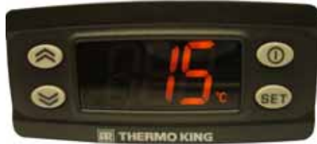
Внутрикабинный блок управления

Электронная система управления состоит из электронного модуля управления (внутри конденсатора) и внутрикабинного блока управления. С помощью внутрикабинного блока водитель грузовика управляет рефрижераторной установкой Thermo King.